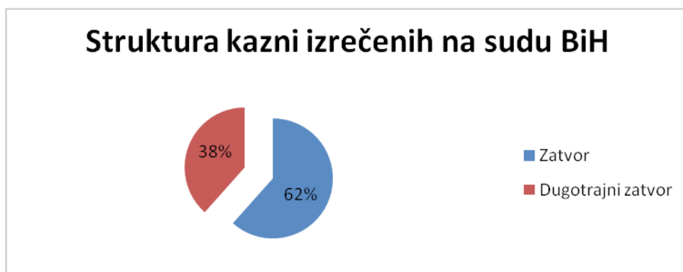
Grafikon 2. Struktura kazni koje je izrekao Sud BiH za ratne zločine

Sud BiH je od svog formiranja pa do izrade ovog rada izrekao ukupno 1976 godina i 11 mjeseci zatvora za počinjene ratne zločine.